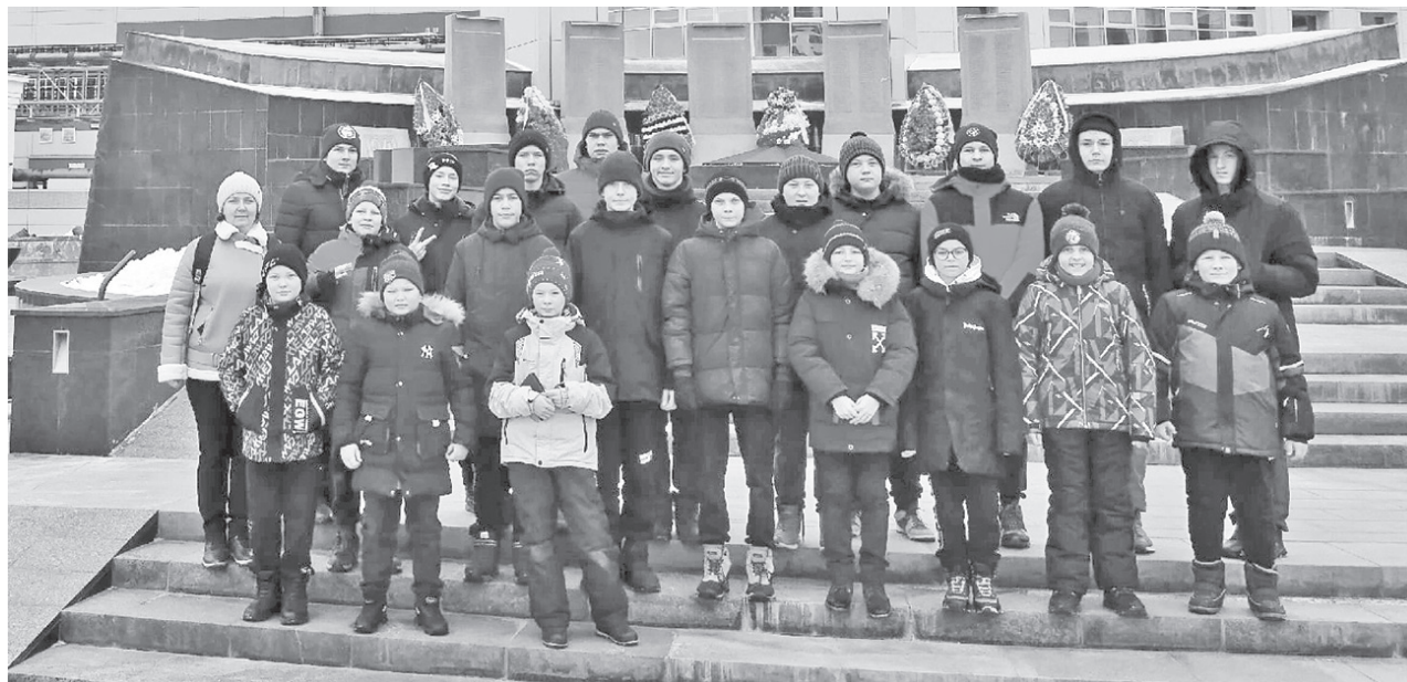
Поездка в музей надолго запомнится всем ребятам.

лена полуторавековая история автомобильной техники России и мира. На первом этаже «живут» самые почтенные «обитатели» музея – машины конца XIX – начала XX века. Глядя на них, понимаешь, что в то время автомобилестроение было настоящим искусством.