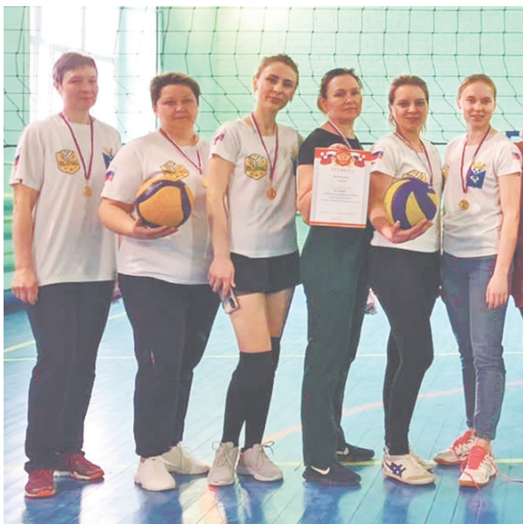
Сборная Баженовского сельского поселения.

Турнир показал: женский волейбол в нашем районе находится в кризисе.