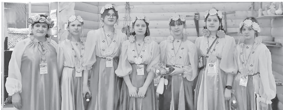
На фестивале «Городок мастеровой» в Екатеринбурге.

же, в красивой шляпе, придумала, организовала и провела эту вечеринку. Ребят ждала игровая развлекательная программа, дети вспомнили и узнали многое о различных головных уборах – цилиндре, таблетке, берете, пилотке, котелке... Соревновались в смешных, подвижных конкурсах. В лотерее никто не