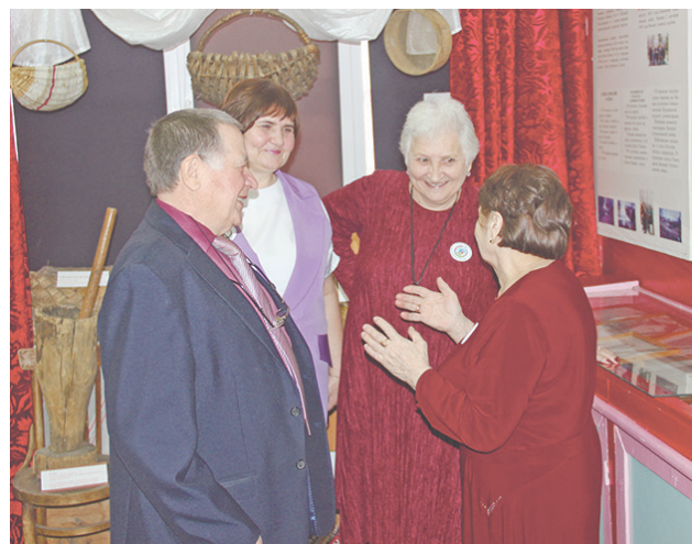
Встреча старых друзей.

Захарова. Предлагает пройти регистрацию и получить памятные сувениры – значок, магнит и авторучку с праздничной символикой. Выпускники, приехавшие из разных уголков района и области, с удовольствием прогуливаются по родным коридорам и классам, с ностальгией вспоминают детство, былые годы, где были моменты радости и детские слёзы, первая любовь и разочарования, удача и ошибки, мечты и вера в будущее.