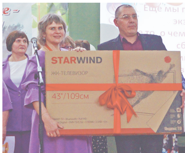
Выпускники 1998-2000 годов подарили телевизор.