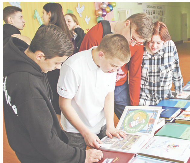
Неподдельный интерес вызвала выставка, рассказывающая о школьной жизни.