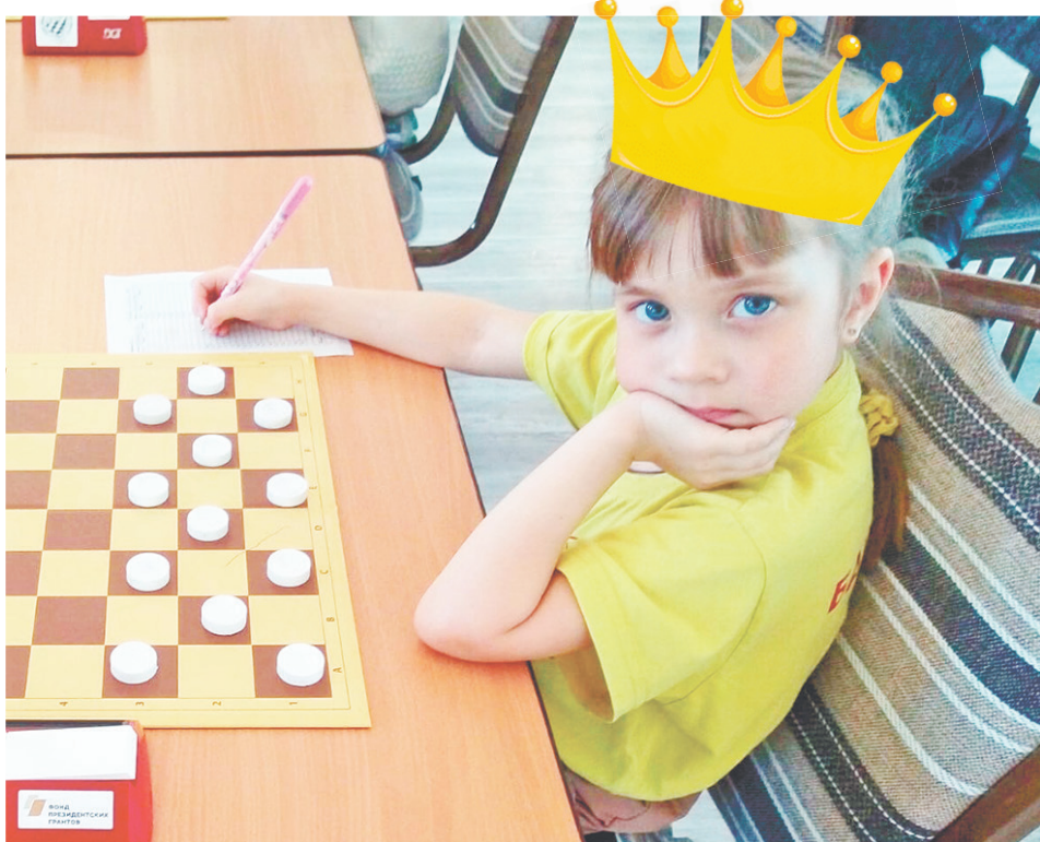
Ксения Короленко – чемпионка России по шашкам.